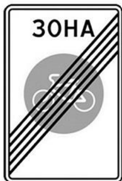
5.34.1 Конец велосипедной зоны