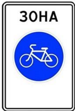
5.33.1 Велосипедная зона